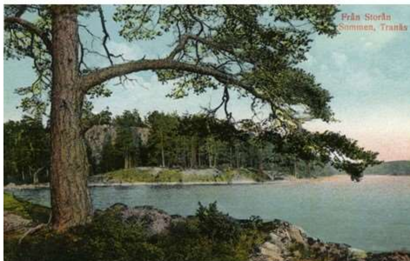
Från Storön Sommen, Tranås