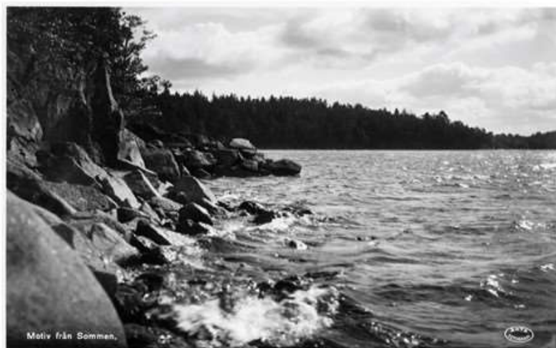
Motiv från Sommen.