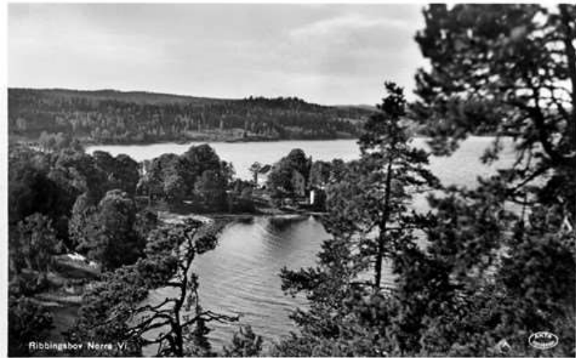
Ribbingbov Nærø Vi.