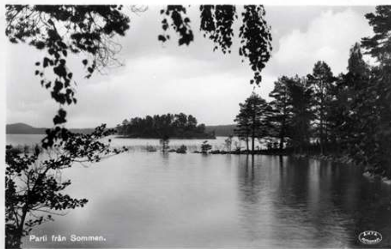
Parti från Sommen.