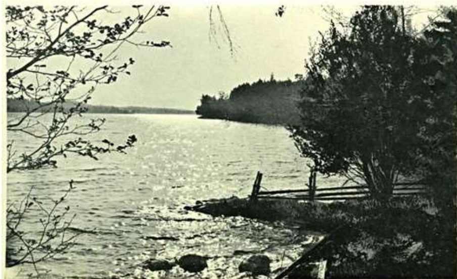
Hätte Udde, Sommen, Tranås