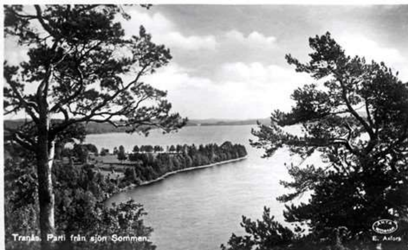
Tranås. Parti från sjön Sommen.