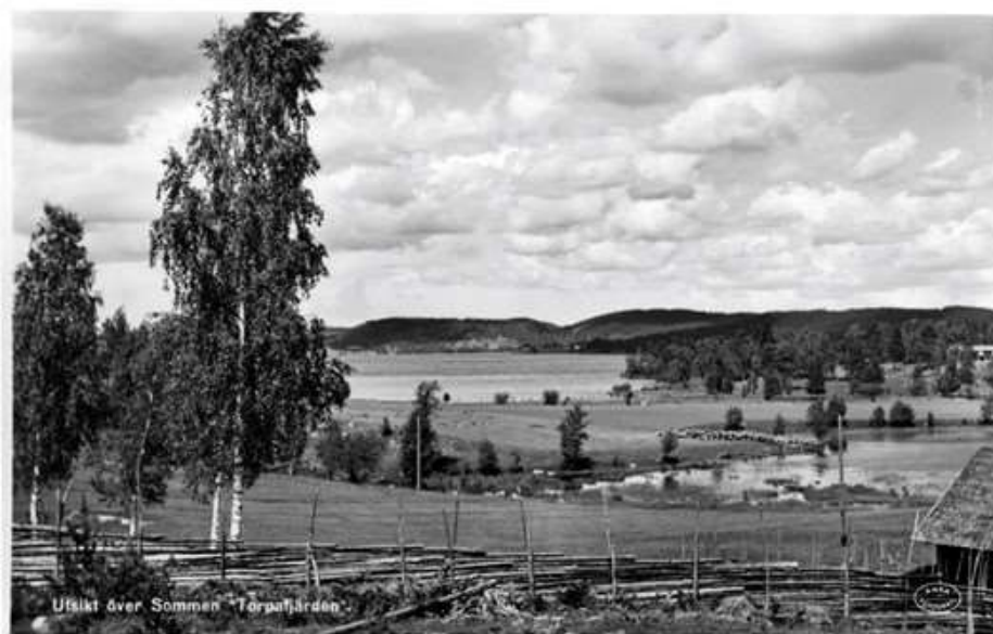
Utsikt över Sommen Torgafjärden