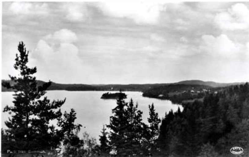
Parti from Sommen. Nærø Vi. Utvikk from Ulvøen.