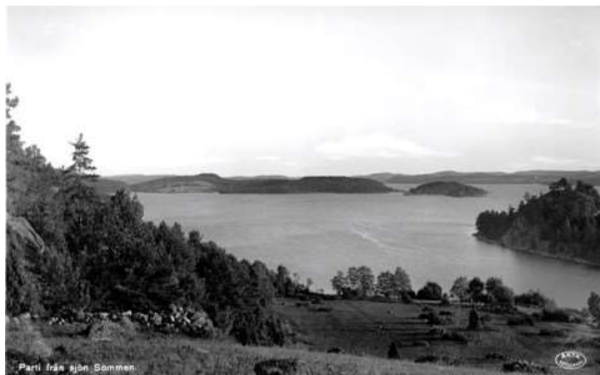
Parti från sjön Sommen.