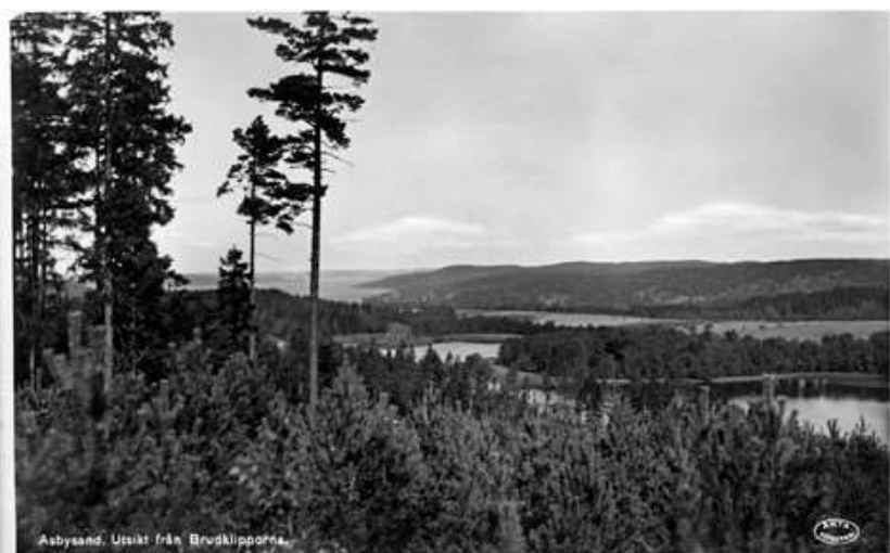
Asbysand. Utsikt från Brudklipporna.