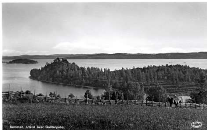
Sommen, Utsikt över Galltorpsö.