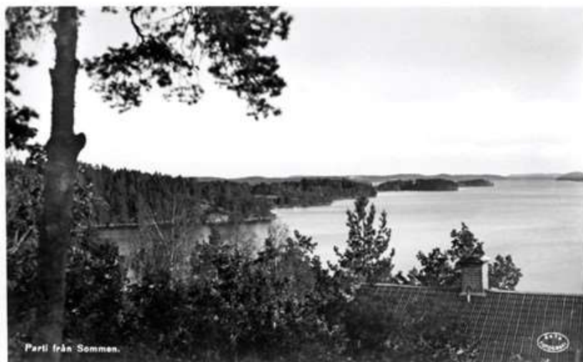
Parti från Somman.