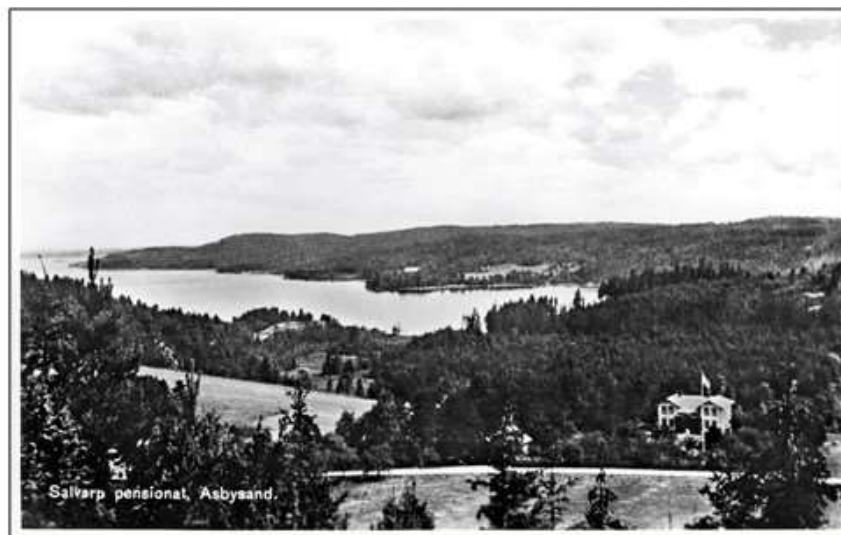
Salvarp pensionat, Asbysand.