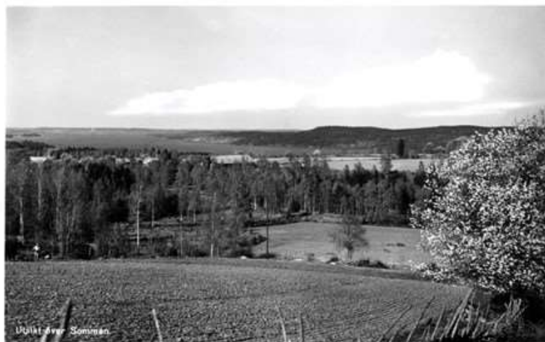
Utsikt över Somman.