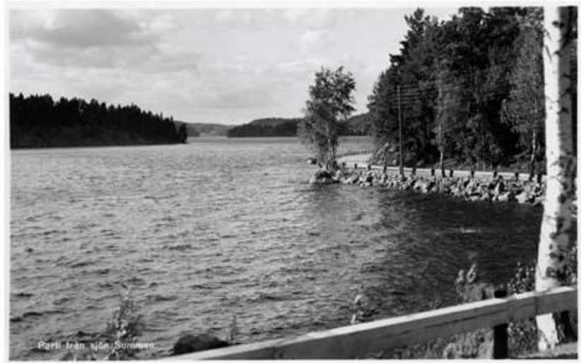
Parti från sjön Somman