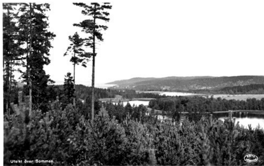
Utsikt över Sommen.