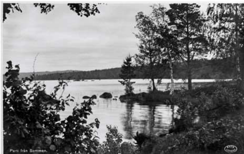
Parti från Sommen.