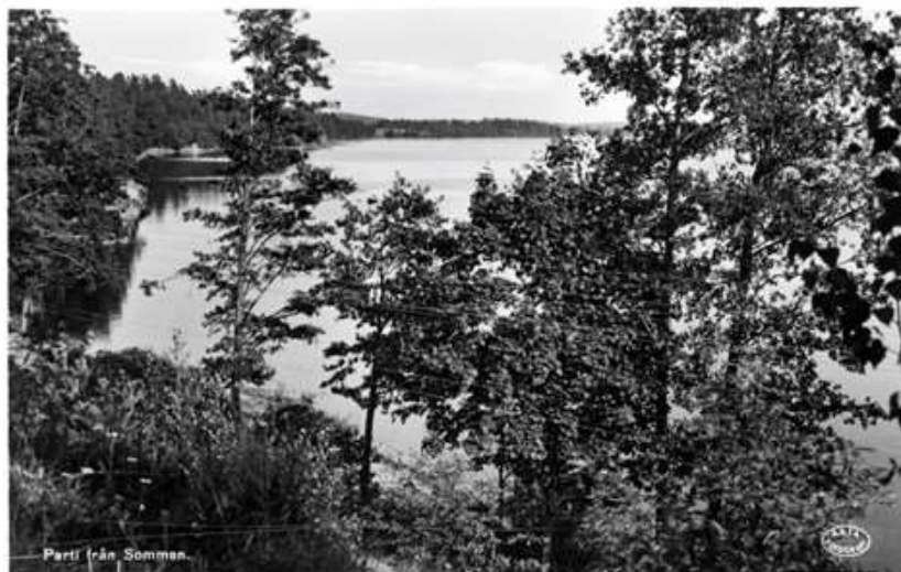
Parti från Somman.