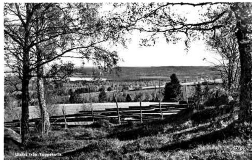
Utsikt från Toppökala