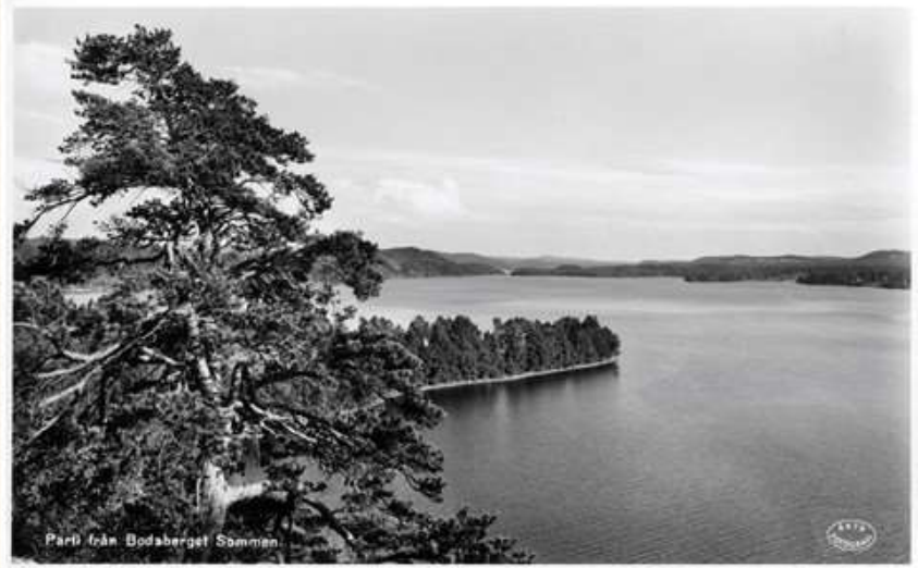
Parli från Bodaberget Sommen