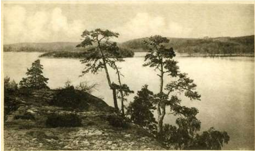
Svalön, Sommen, Trands.