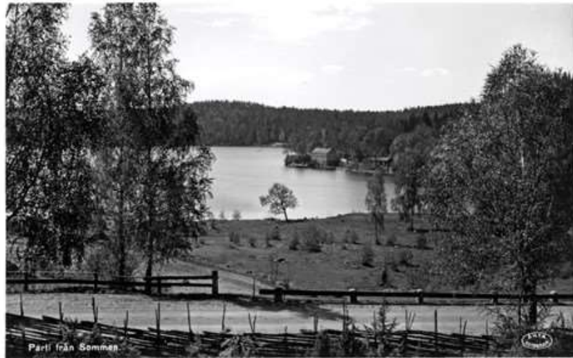
Parti från Somman