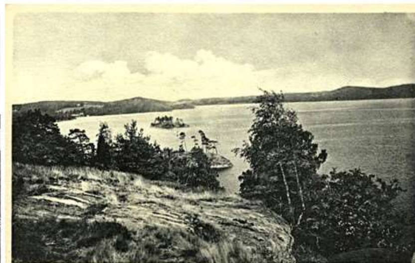
Sommen från Storön