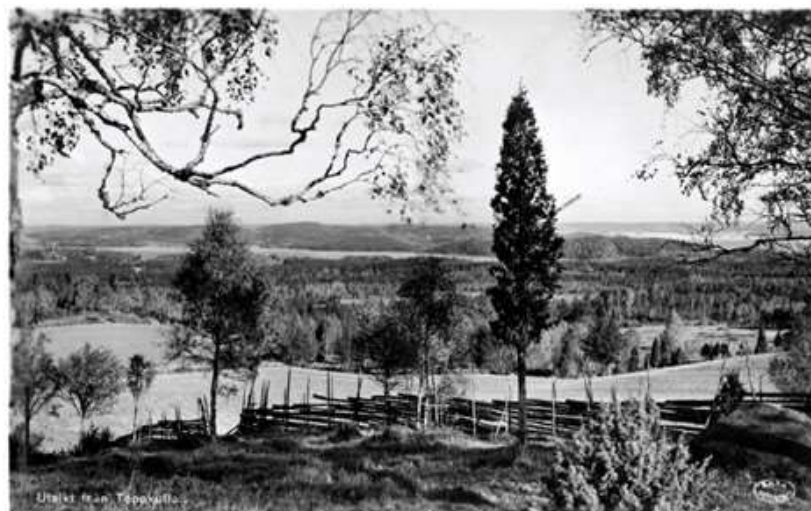
Utsikt från Toppökala