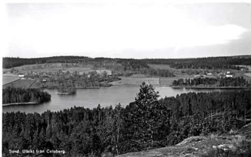
Sund. Utsikt från Celoberg.