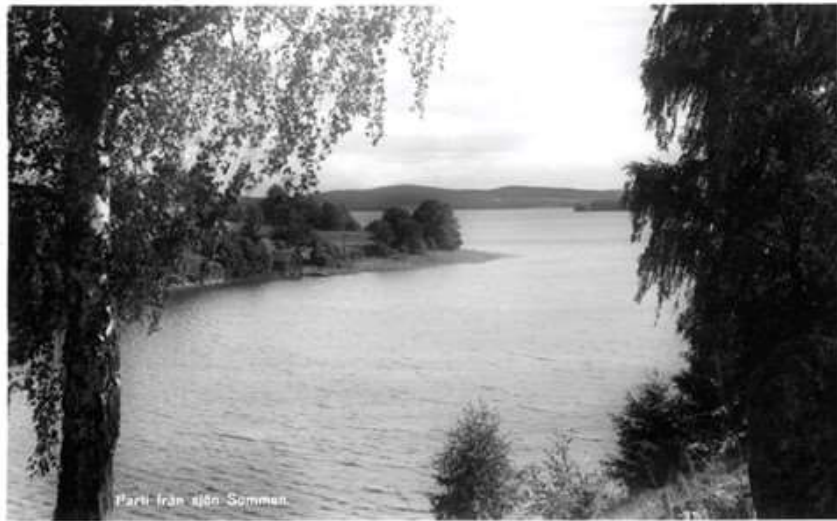
Parti från sjön Somman