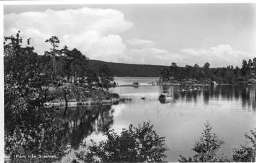
Parti från Somman.