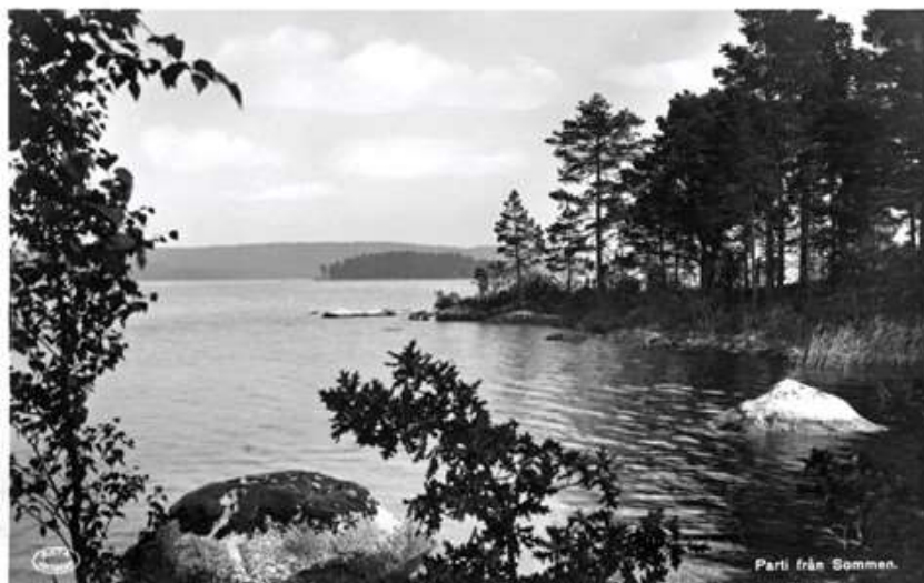
Parti från Sommen.