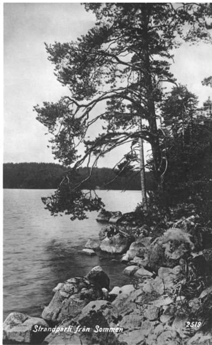
Strandparti från Sommen