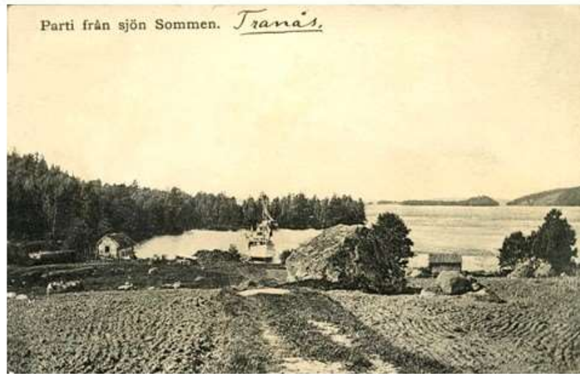
Parti från sjön Sommen. Trana's.