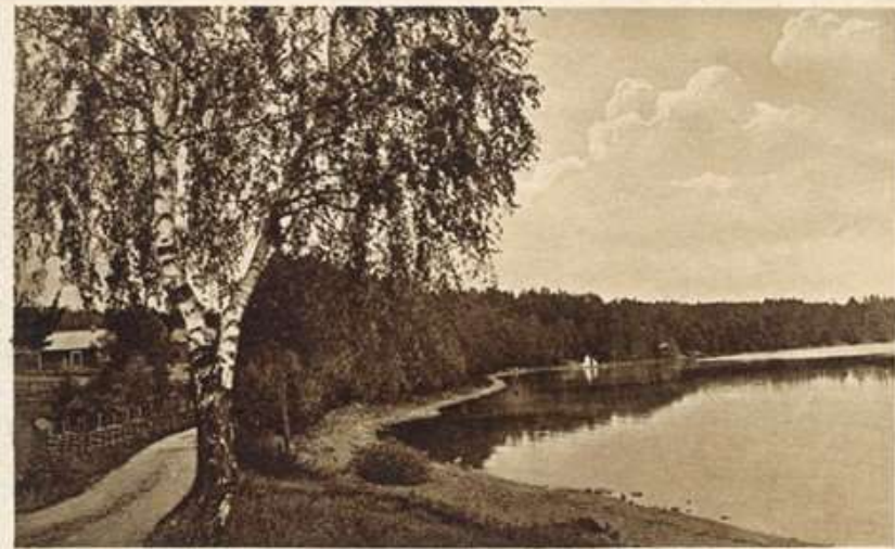
Örnäs Vägen till Torshol & Rimmaris