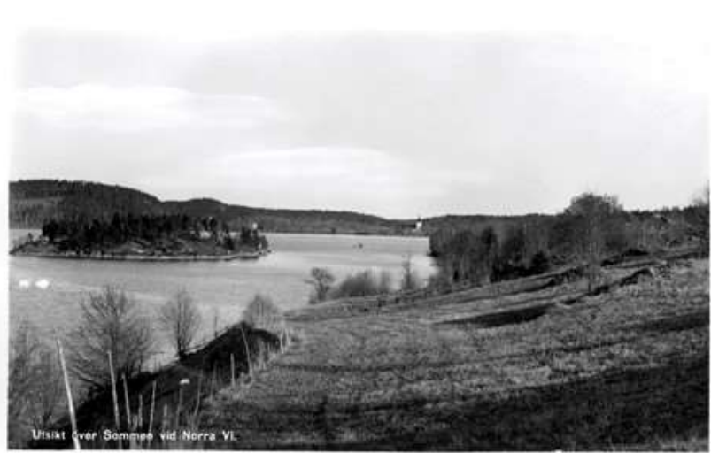
Utsikt över Somman vid Norra VI.