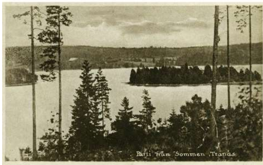
Parti från Sommen Tranås