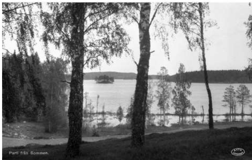
Parti från Sommen.