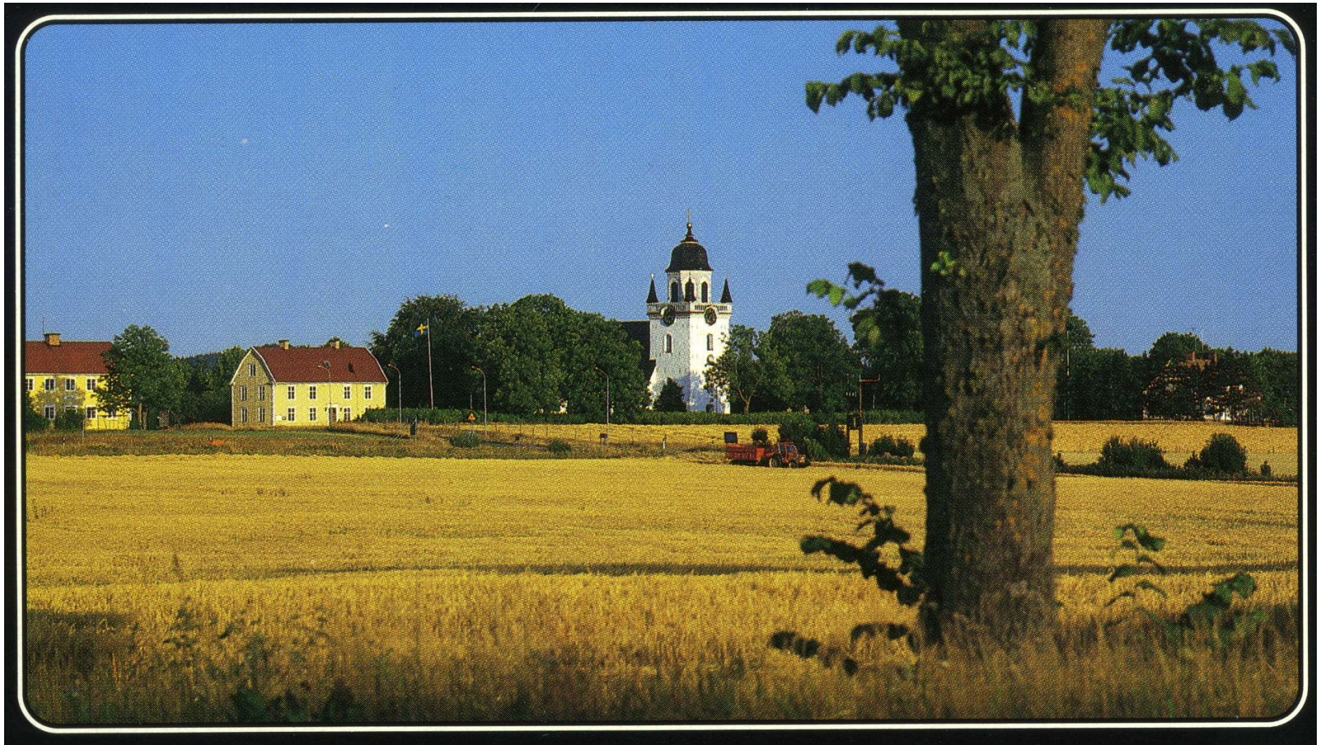
Mellan träverken åt vänster tecknar sig det karakteristiska tornet på Säby medeltidskyrka.