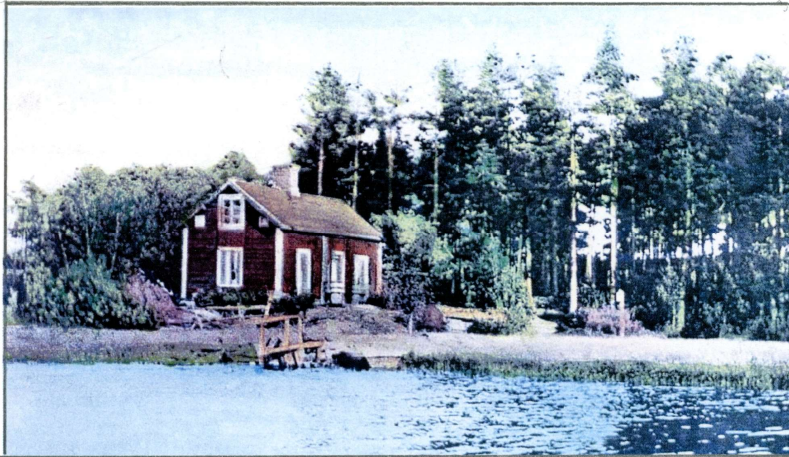
Östanåstugan i första hälften av 1900-talet med båtbygga mot Svartån