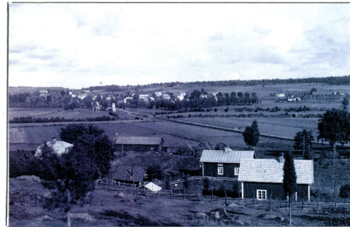
Bilden över Ådala är tagen från Väderkvarnsberget mot Sandhulevägen och Gripenberg

August och Lovisa hade torpet Sandhulan, det lyste under denna tid Obergas herrgård och kammarherre Bogeman. Torpet låg på sluttningen av "Väderkvarnsberget" väster om Gripenberg alldeles intill gamla landsvägen mot Linderås strax efter bron över Svartån.