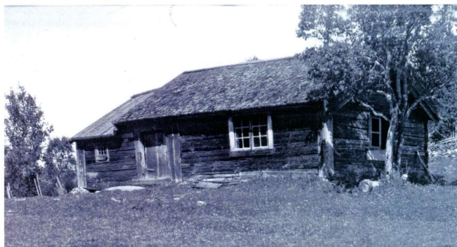
På bilden ser man Ljungstugan på Falla gård, 1930 innan den flyttades till Hembygdsparken i Tranås.

flyttades från Falla i Säby socken och monterades upp i Hembygdsparken i Tranås. Den så kallade Ljungstugan.