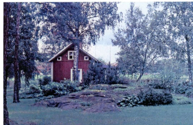
Bilden är tagen av Anders Andersson 1965

ÖSTANÅSTUGAN , blev ett vackert minne från de vackra promenaderna "Lilla jorden Runt"