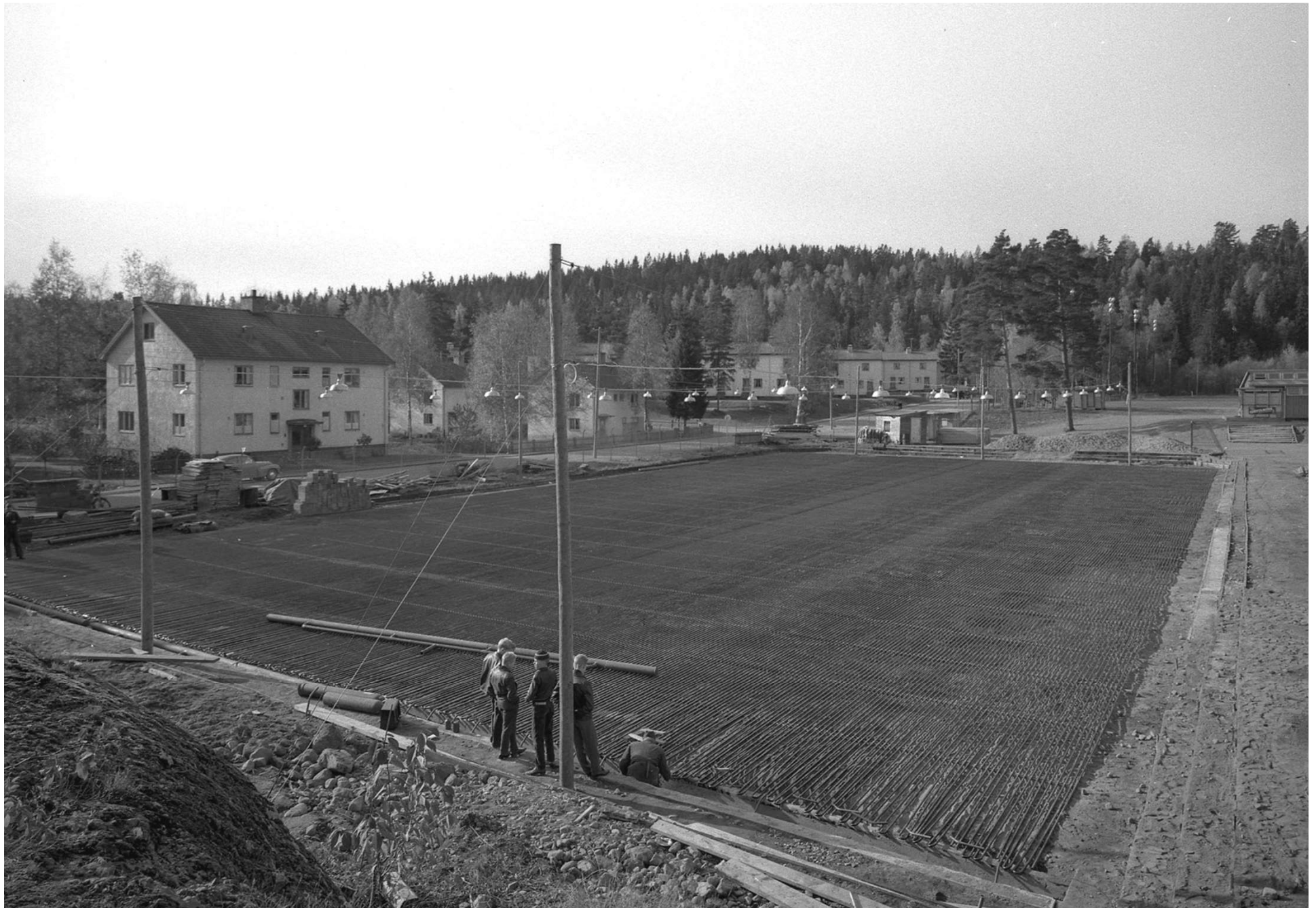
Nu är rörbädden utlagd och färdig.