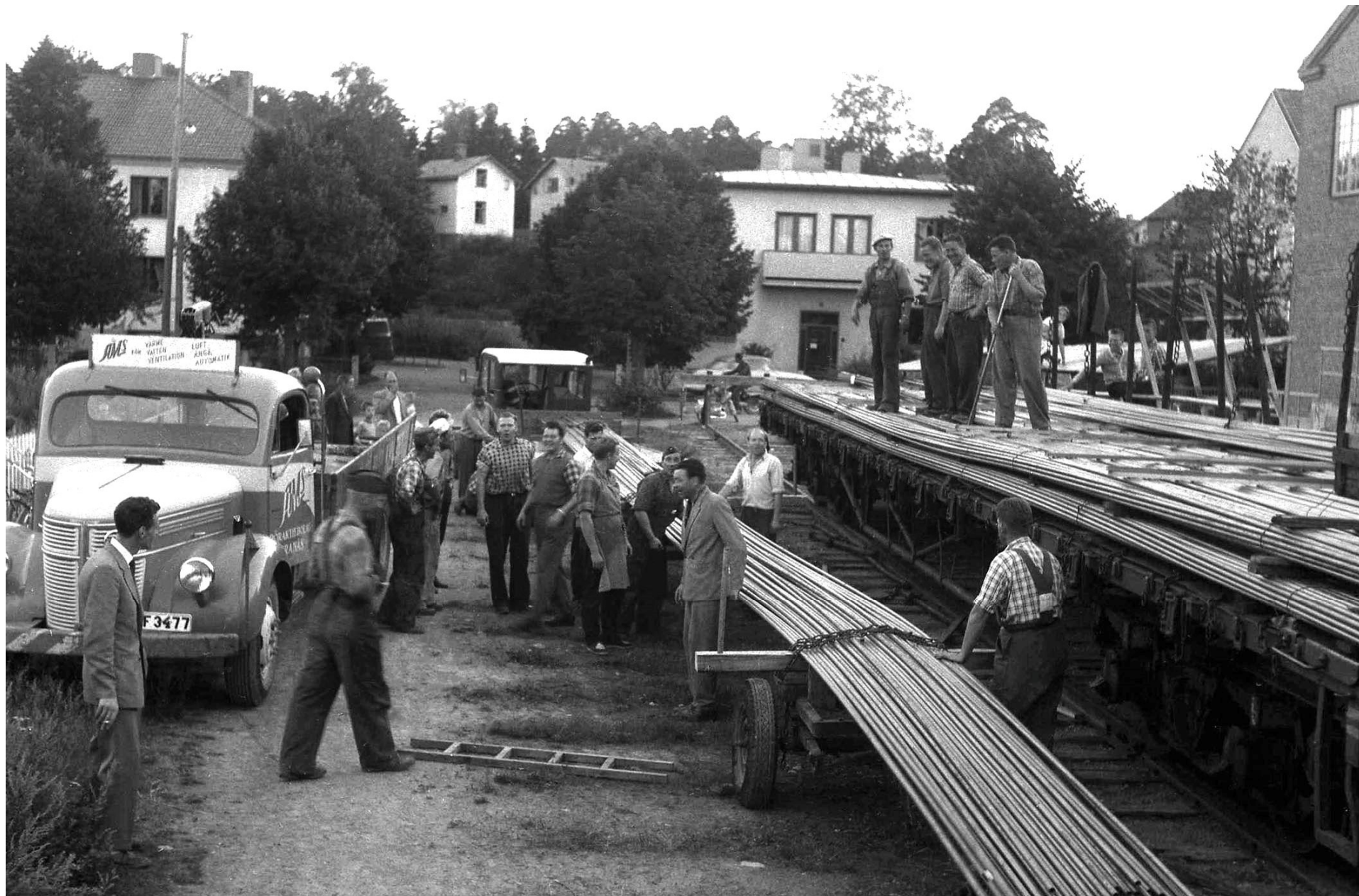
Frysören kommer med järnväg på stickspåret till slakthuset och lastas om till en specialbyggd vagn som dras av en traktor upp till isbanan.