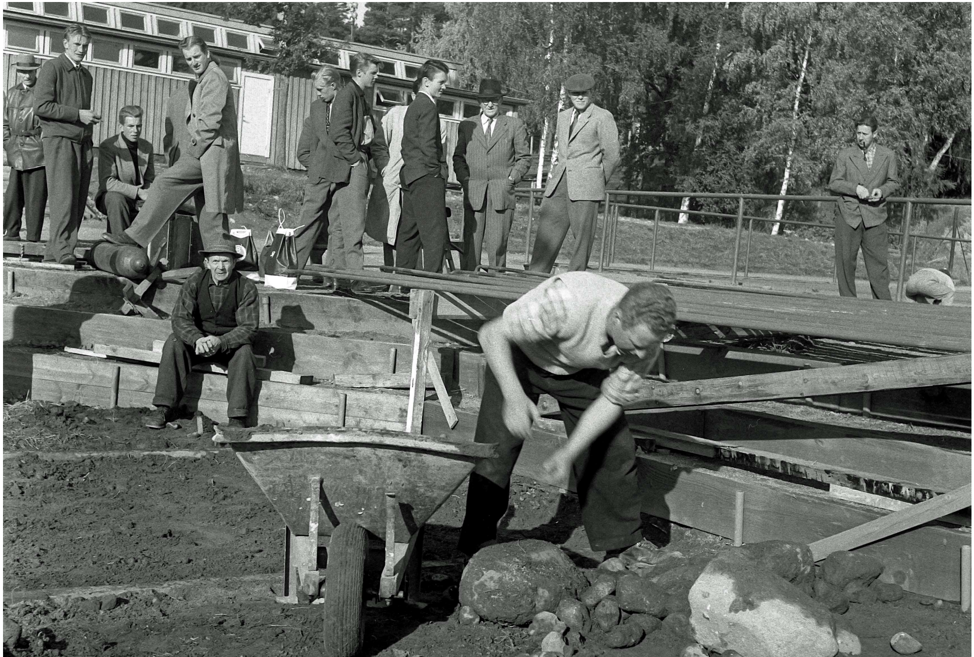
Tranås konstfrusna isbana nr 13 i landet, 1957.

Tranås konstfrusna isbana blev färdig på 9 månader fram till invigningen 17 november 1957