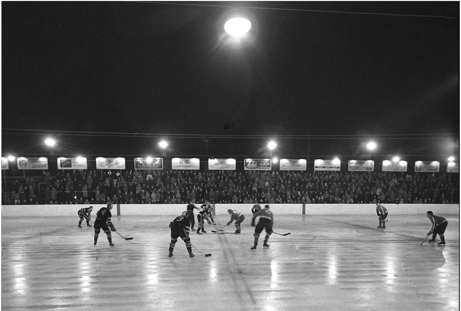
Tekning för matchstart på Ängaryds IP. TAIF mot Östtysklands landslag den 26/10 1959.