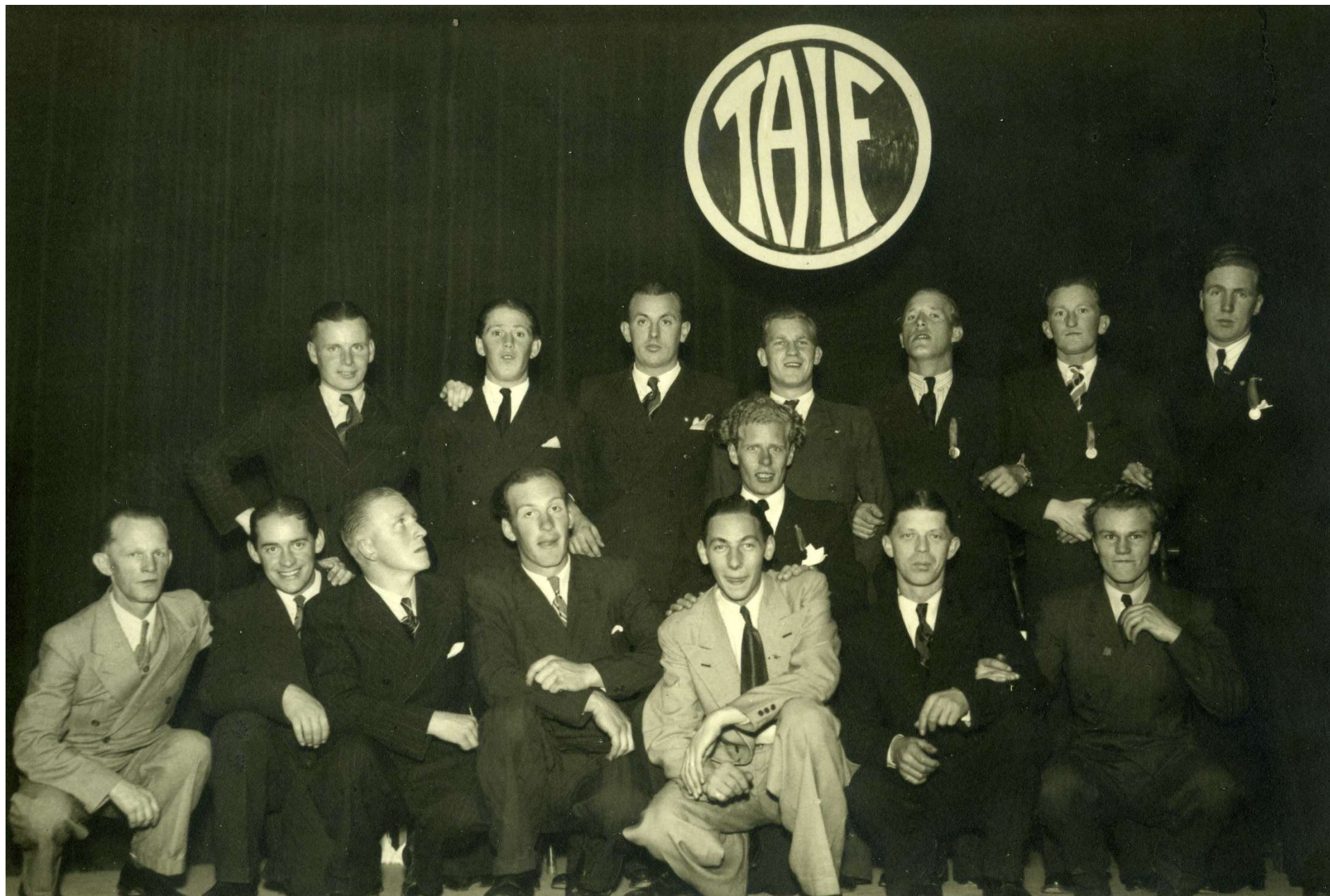
Glada TAIF:are årtal okänt. Namn ?