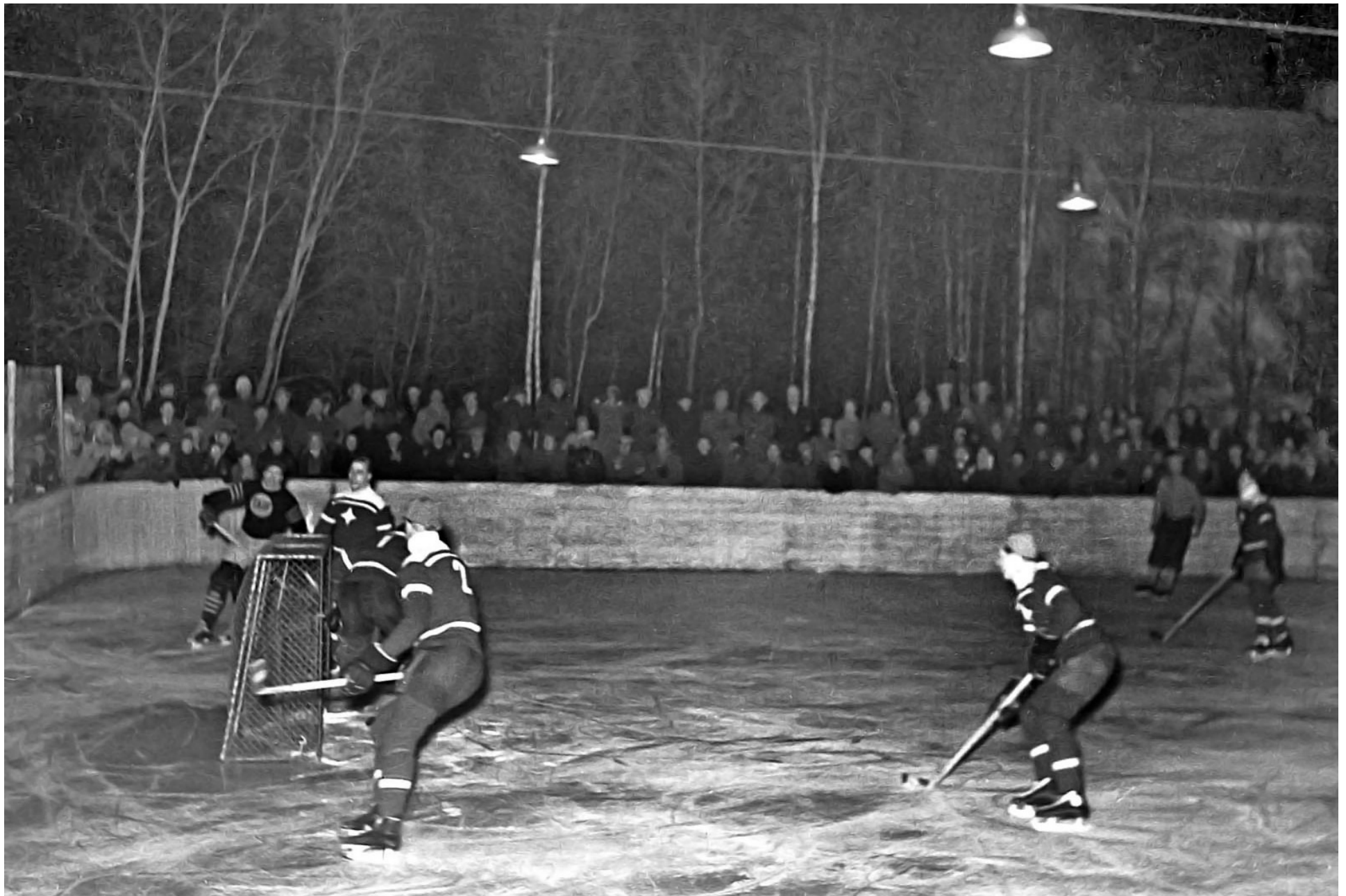
Hemmamatch och förlust mot IFK Norrköping i serien 1950.