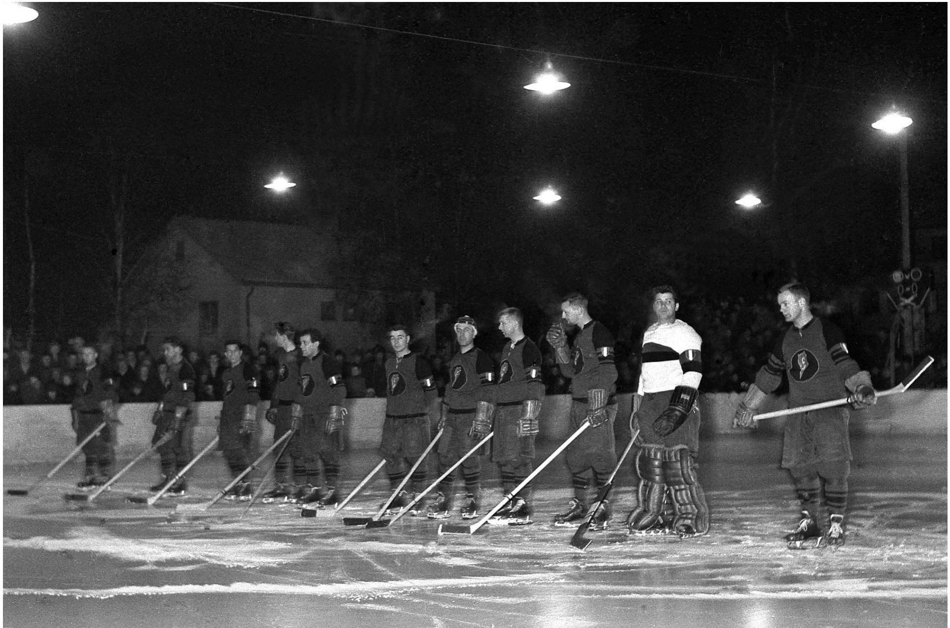
Italienska proffslaget Diavoli Rosso Neri som fick stryk av Tranåslaget på Ängaryds månskensrink den 22 februari 1954 med 5-3.