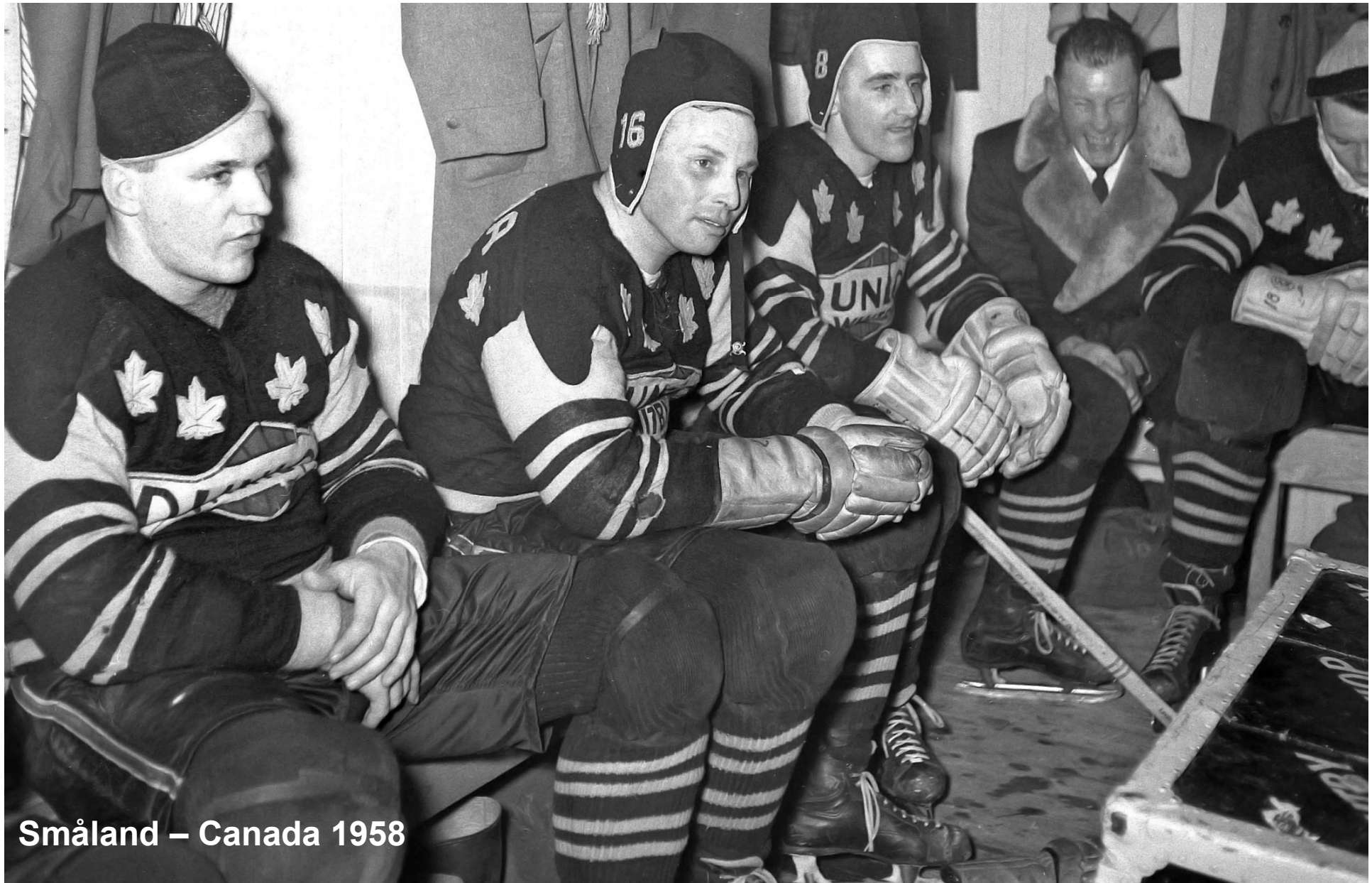
Småland – Canada 1958

Garvade Dunlops spelare vid matchen mot Småland på Ängaryds IP 25/2 1958. Strålande uppvisning av det kanadensiska laget "Dunlop United" i Tranås, 18-2 mot Smålandslaget. "Så har vi äntligen fått se hur äkta Kanadensisk ishockey spelas"