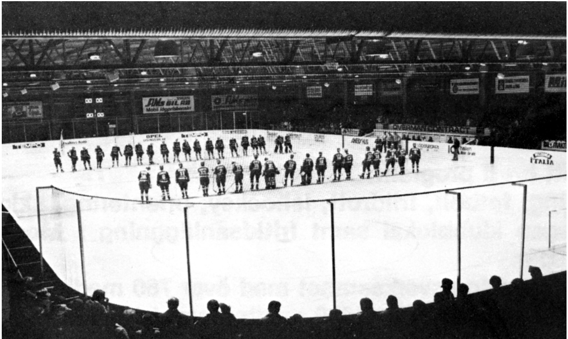
Drömmen är en verklighet. Bilden är från den inofficiella invigningsmatchen, TAIK - Örebro IK, 30 september 1978