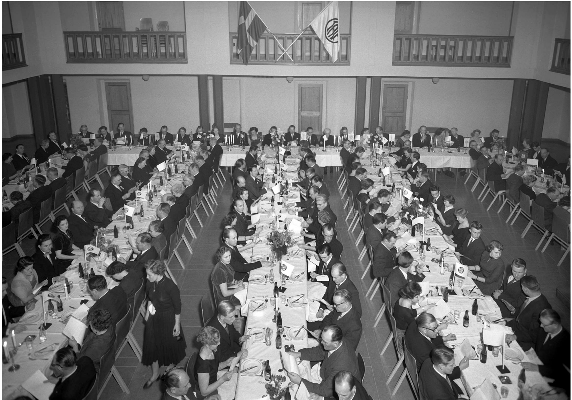
50-års firandet avslutades med en bankett i Tranås stadshus 1955