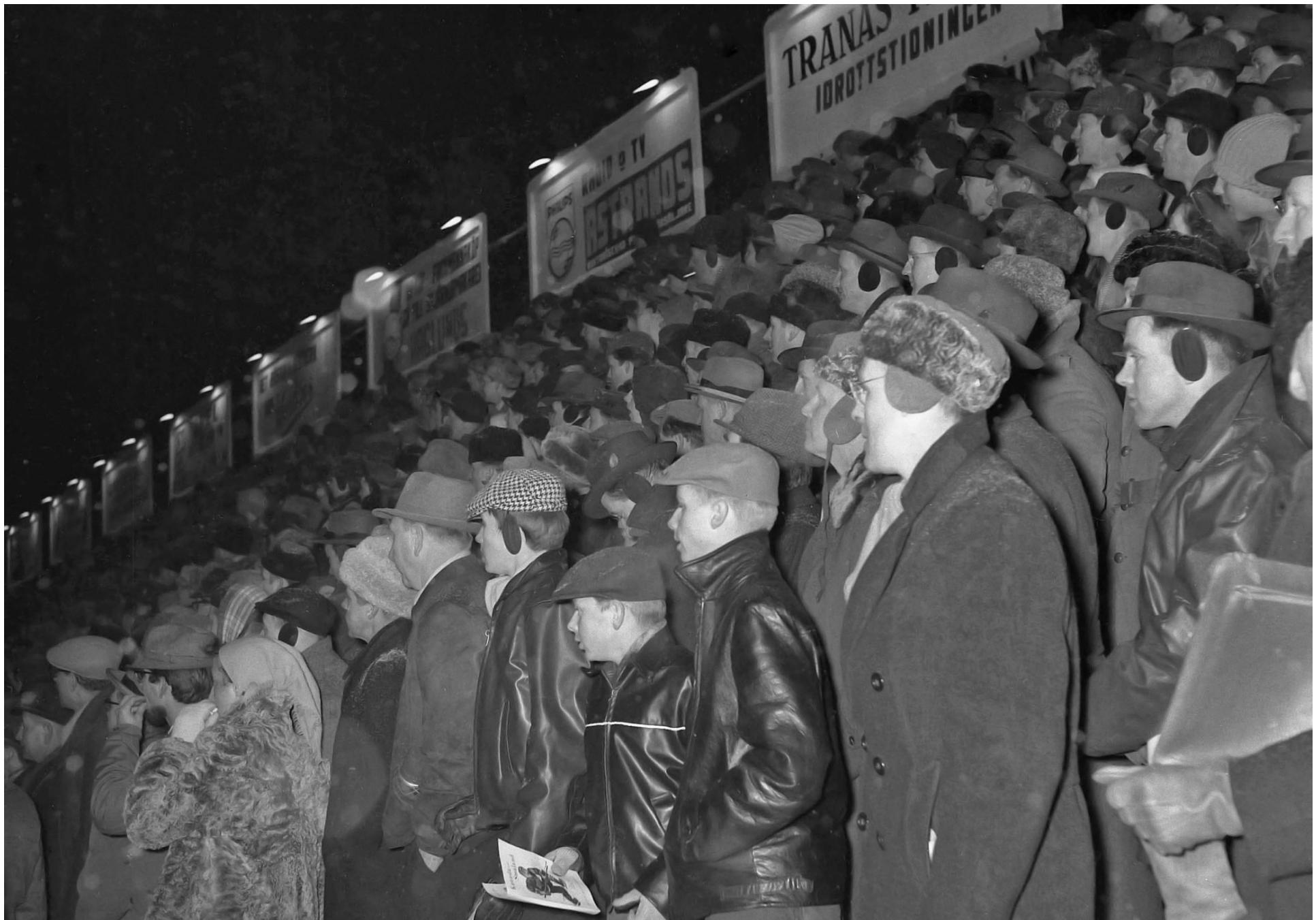
En mycket stor publik följde spelet som för det mesta tilldrog sig i den Småländska försvarszonen.