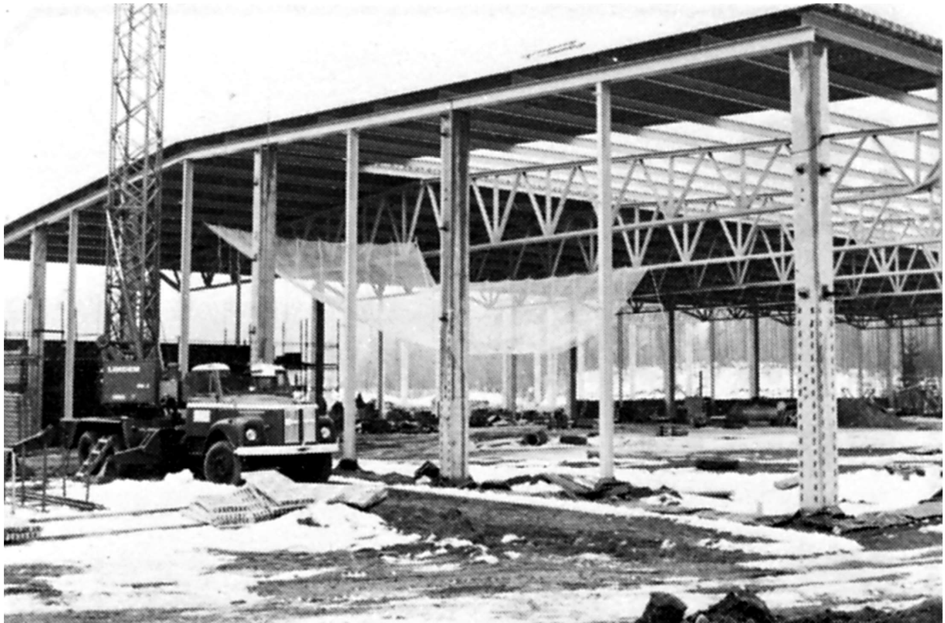
Entreprenörernas arbete fortlöpte i planerad takt, nu är taket under montering.