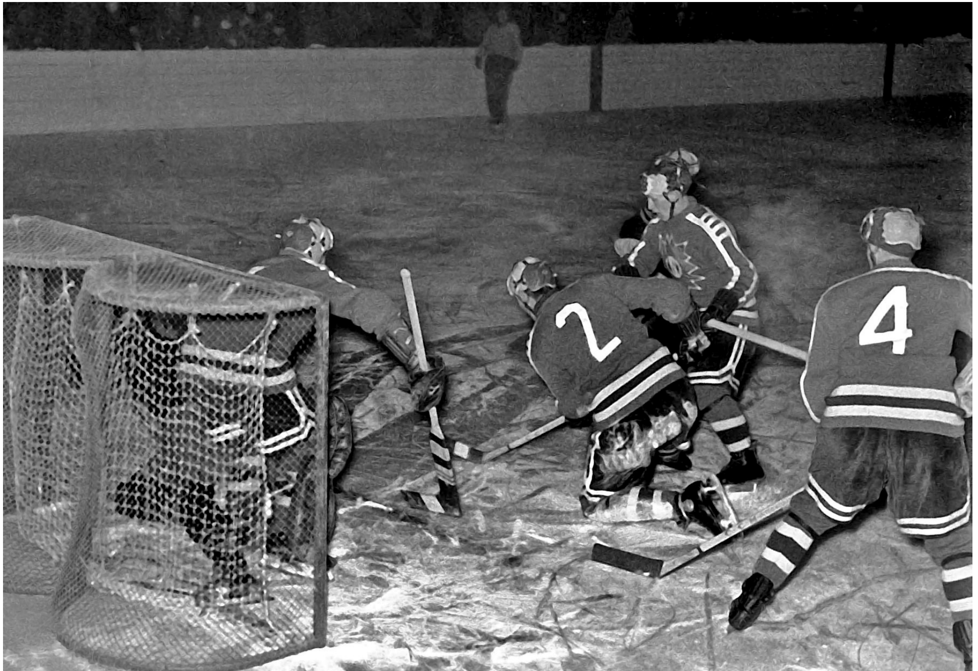
TAIF – Vättersnäs 1952