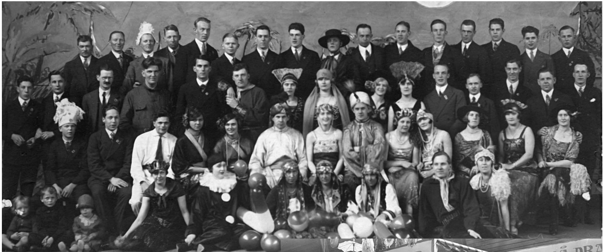
Medverkande vid Idrottsbazaren i Tennishallen år 1929